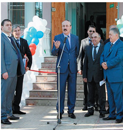
Президент Республики Дагестан Рамазан Абдулатипов дал старт цифровому телевидению в Дагестане