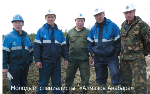
Молодые специалисты «Алмазов Анабара»

среднего профессионального образования. В соответствии с четырёхсторонними договорами о целевой подготовке, обучаются студенты по следующим специальностям: «Открытые горные работы», «Горные машины и оборудование», «Геологическая съёмка, поиски и разведка месторождений полезных ископаемых», «Геофизические методы поисков и разведки месторождений» и другим.