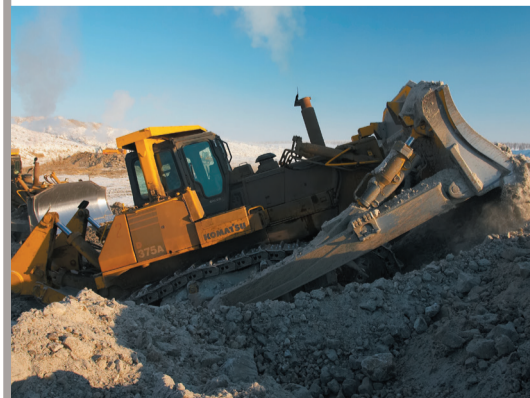
Работы по мерзлому грунту

За 2013 год по двум Обществам ОАО «Алмазы Анабара» и ОАО «Нижне-Ленское» добыто алмазов на 320,4 млн долл. США (105,5% к плану 2013), реализовано на 426,8 млн долл. США (101,2% к плану 2013). По итогам 2013 года по двум Обществам выручка составила 13,8 млрд рублей, чистая прибыль — 2,2 млрд рублей, в том числе по ОАО «Ал-