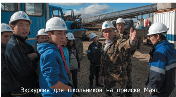
Экскурсия для школьников на прииске Маят