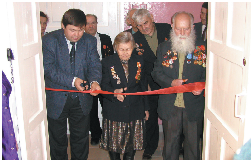
Открытие музея Трудовой славы ОАО «Красный пролетарий» с участием ветеранов ВОВ и труженников тыла.

Министерство промышленности и торговли Российской Федерации признало ОАО «Красный пролетарий» лучшим экспортёром машиностроения РФ в 2008 году и самым динамично развивающимся российским экспортёром в 2009 году. ОАО «Красный пролетарий» присвоено почетное звание «Ответственный налогоплательщик года», предприятие является лауреатом республиканского конкурса «Лучшие товары Башкортостана» и Программы «100 лучших товаров России» по итогам 2009 г.