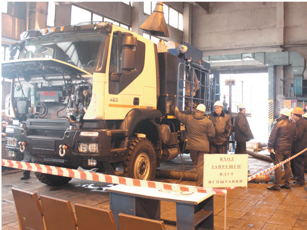
Испытания продукции с представителями заказчика

Стратегия предприятия за всё время существования завода не акцентировалась на сокращении численности. Ни один человек на предприятии за это время не был сокращён или уволен по инициативе администрации. Здесь важно понимать, что коллектив всегда являлся носителем уникальных технологий, практики и корпоративных знаний. Одним из ключевых приоритетов предприятия является повышение конкурентоспособности на рынке труда. В этих условиях самым значимым элементом в осуществлении кадровой политики является развитие человеческих ресурсов, привлечение высококвалифицированных специалистов. Основным источником привлечения персонала являются молодые специалисты из профильных учебных заведений, поэтому большое внимание уделяется сотрудничеству с образовательными учреждениями города и Республики. Договора о сотрудничестве заключены со всеми профильными учебными заведениями города Стерлитамака и Республики Башкортостан.