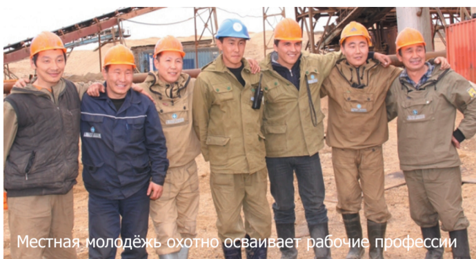
Местная молодёжь охотно осваивает рабочие профессии