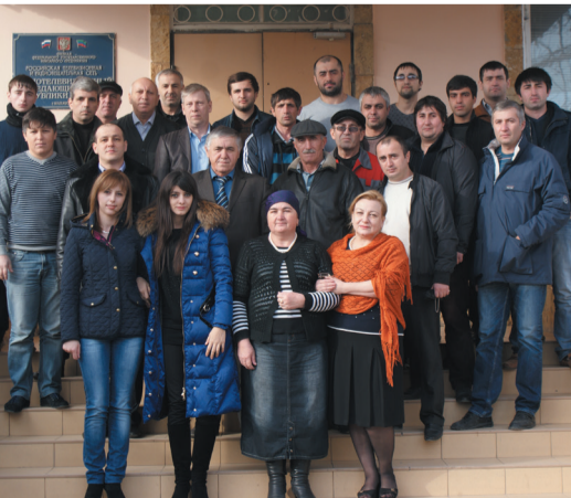
Коллектив РТПЦ Республики Дагестан

Один из крупнейших и стабильно развивающихся предприятий республики Дагестан в сфере распространения телевизионных и радиовещательных программ и сопутствующих услуг связи. Для выполнения основной деятельности РТПЦ РД на протяжении 53 лет успешно развивает свою инфраструктуру с техническими зданиями, телевизионными башнями (мачтами), оборудованием и энергообеспечением. Мощные и маломощные радиотелевизионные передаточные станции расположены во всех крупных городах, районных центрах и в других населенных пунктах республики, они обеспечивают уверенный прием телевизионных и радиовещательных программ в самых отдаленных уголках горной республики. В состав РТПЦ входят четыре мощные радиотелевизионные передающие стан-