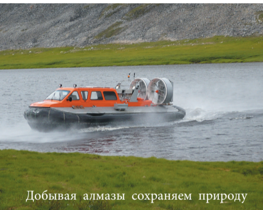
Добывая алмазы сохраняем природу

тительного слоя тундры предприятие использует технику на шинах низкого давления, суда на воздушной подушке. Кроме того, промывка алмазосодержащих песков производится прямо на месте вскрыши, что позволяет не перемещать «материнскую» породу, а оставлять ее на месте выемки, вследствие чего минимизируется негативное влияние на окружающую среду.