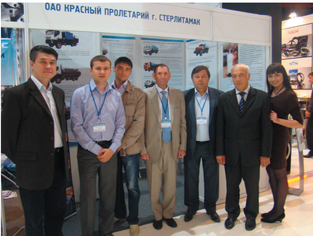
Международная выставка «Газ. Нефть. Технологии.» г.Уфа

Строительство скважины на структуре Рыбачья ведется самоподъемной плавучей буровой установкой Астра.