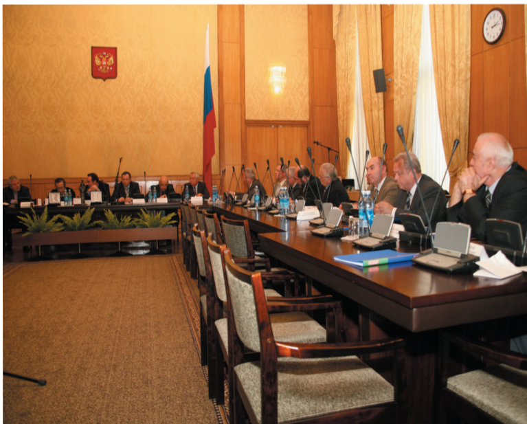
Заседание Российской общественной комиссии по Петровским наградам

«Я предупреждаю, что россияне когда-нибудь, а может быть, при жизни нашей, пристыдят самые просвещенные народы успехами своими в науках, неутомимостью в трудах и величием твердой и громкой славы».